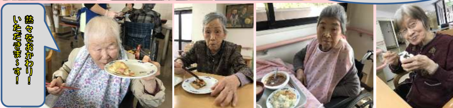
熱々をおかわり！ いただきます！