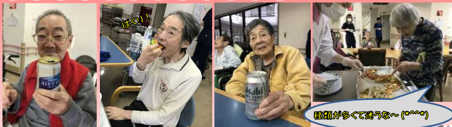
種類が多くて迷うな～(*^^*)