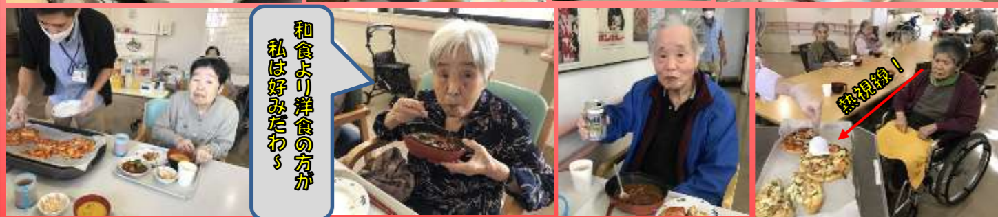
和食より洋食の方が 私は好きだわ！