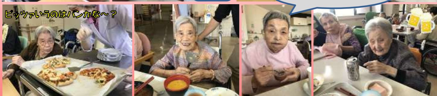
ピッツァいっけいのはパンかな～？